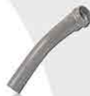
Bend Rubber Ring Spigot 11 1/2° - 90°