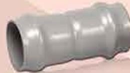
Socket All Rubber Ring