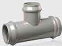
Reducer TEE All Rubber Ring