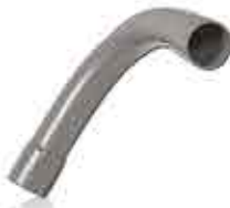
Bend All Socket Solvent Cement 11 1/2° - 90°