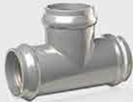
TEE All Rubber Ring