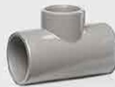
Reducer TEE Solvent Cement