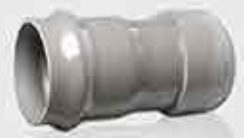
End Cap Rubber Ring